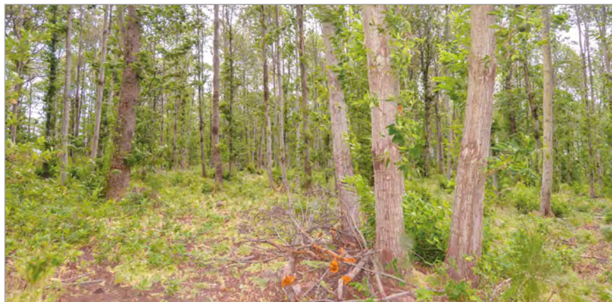
Foto 3 - Castagneti del Monte Amiata a turno lungo che producono pali di grandi dimensioni e travi. Questi boschi a maturità hanno una densità ed una struttura simile a quella dei boschi d'alto fusto.