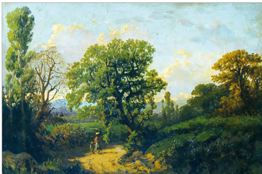
Foto 1 - Il bosco nel paesaggio storico toscano dipinto dai pittori macchiaioli è sempre un bosco aperto, alternato a campi, prati e con la presenza costante dell'elemento umano (SERAFINO DE TIVOLI, Paesaggio "seconda maniera", collezione privata - www.pandolfini.it/it/asta-0275/serafino-de-tivoli.asp ).

Contrariamente ai luoghi comuni, l'interazione dell'uomo con il sistema naturale ha addirittura contribuito a creare anche aree ad elevata biodiversità, oggi tutelate dalla Rete Natura 2000 (FARINA 2000) . Certamente, conciliare le esigenze del paesaggio, della biodiversità, del clima e della produzione di beni non è sempre facile, anche perché in Italia esiste un mosaico di competenze che richiede una delicata azione di coordinamento (SITZIA 2020). Infatti, mentre la competenza primaria relativa al paesaggio spetta al Ministero per i Beni e le Attività Culturali e per il Turismo (e quindi alle Soprintendenze), le normative e le politiche ambientali di conservazione della biodiversità (che oltre alle Aree