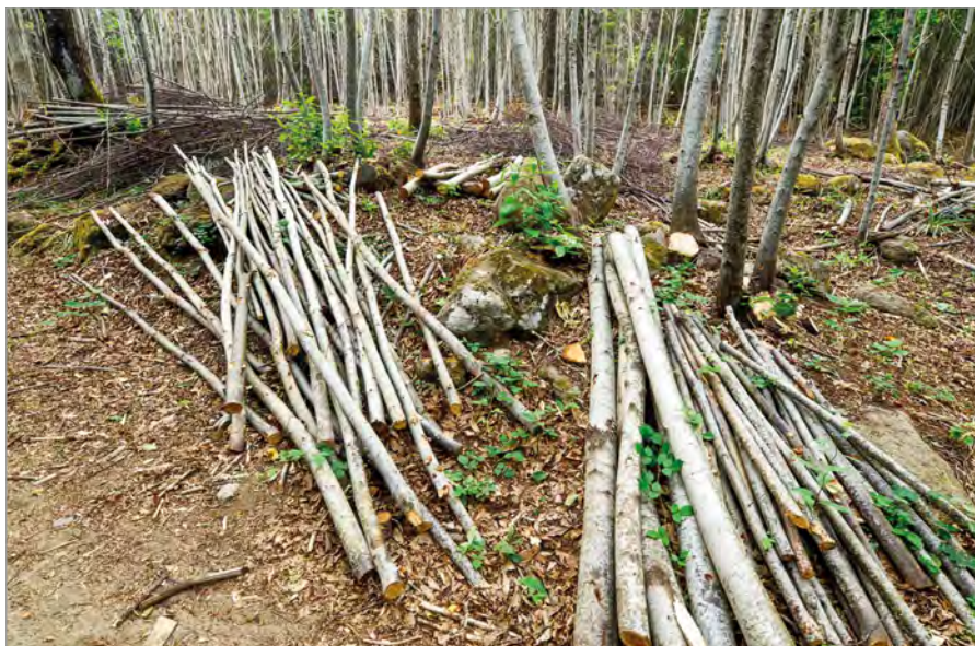
Foto 2 - Il prodotto tradizionale dei cedui di castagno del monte Amiata è la paleria. La produzione di paleria di castagno non solo è funzionale alla conservazione del paesaggio tradizionale del Monte Amiata ma anche al mantenimento di altri paesaggi tradizionali toscani, come ad esempio i vigneti del Chianti che utilizzano questo prodotto.